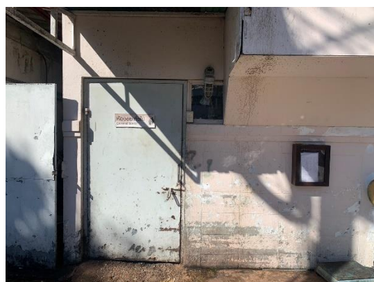
รูปที่ 2-12 ห้องพักขยะทั่วไป