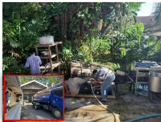
รูปที่ 2-2 การดูดไขมัน จากบ่อดักไขมันไปกำจัด