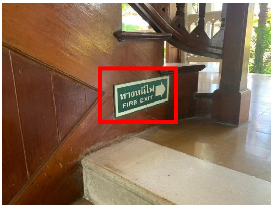
รูปที่ 2-22 ป้ายแสดงเส้นทางหนีไฟภายในอาคาร