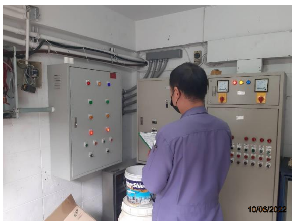
รูปที่ 2-9 การตรวจสอบดูแลระบบบำบัด