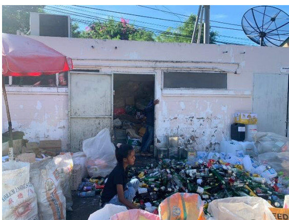
รูปที่ 2-17 การคัดแยกขยะรีไซเคิล และจัดบันทึกปริมาณ