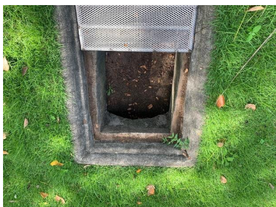
รูปที่ 2-11 บ่อดักตะกอนของรางระบายน้ำฝนที่ตกในพื้นที่ โรงแรม ก่อนระบายออกจากพื้นที่