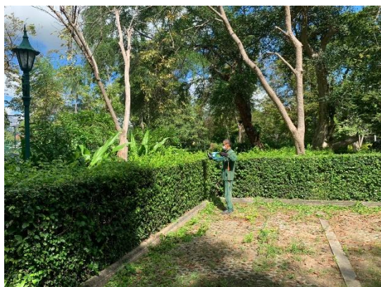
รูปที่ 2-20 (ต่อ) บำรุง ดูแล รักษาพื้นที่สีเขียว