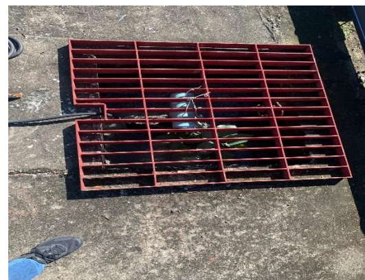
รูปที่ 2-4 บ่อเติมอากาศ