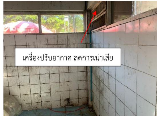
รูปที่ 2-14 เครื่องปรับอากาศและระบบระบายอากาศ ภายในห้องพักขยะทั่วไป