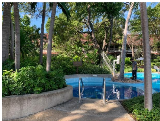
รูปที่ 2-20 (ต่อ) บำรุง ดูแล รักษาพื้นที่สีเขียว