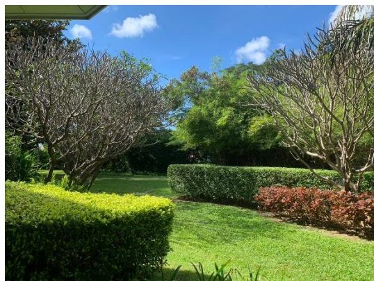
รูปที่ 2-19 (ต่อ) พื้นที่สีเขียวภายในโรงแรม