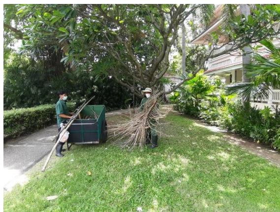
รูปที่ 2-20 (ต่อ) บำรุง ดูแล รักษาพื้นที่สีเขียว