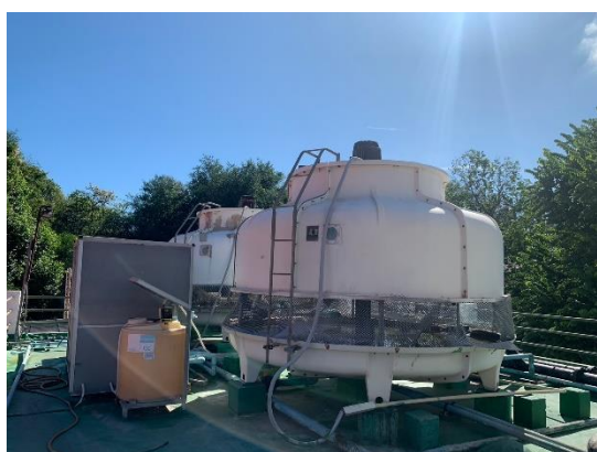
รูปที่ 2-34 (ต่อ) การตรวจสอบ บำรุงรักษา ระบบหอผึ่งน้ำ (Cooling Tower)