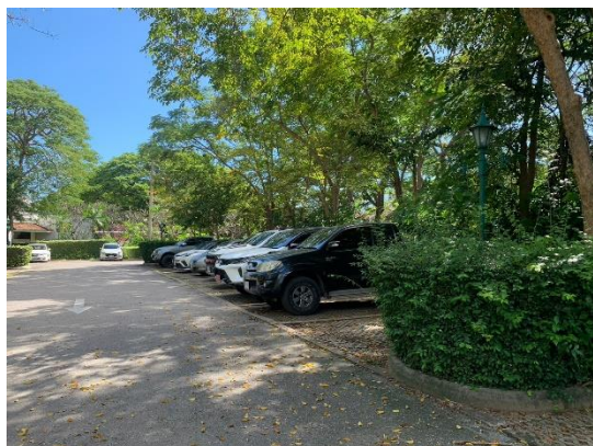
รูปที่ 2-32 ลานจอดรถสำหรับผู้เข้าใช้บริการและลาน จอดรถสำหรับพนักงาน