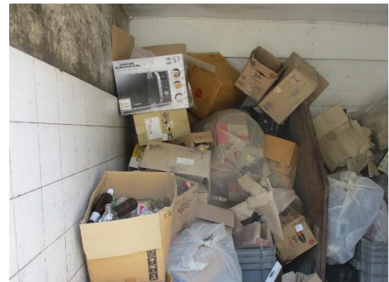
รูปที่ 2-16 ภายในห้องพักขยะรีไซเคิล