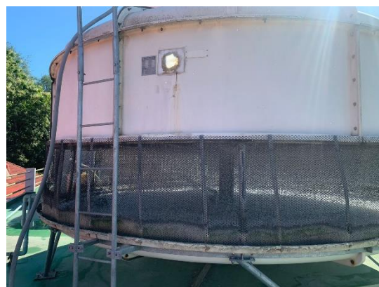
รูปที่ 2-34 การตรวจสอบ บำรุงรักษา ระบบหอผึ่งน้ำ (Cooling Tower)