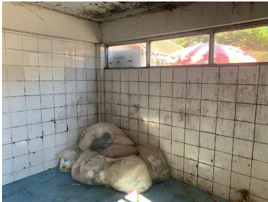
รูปที่ 2-13 ภายในห้องพักขยะทั่วไป