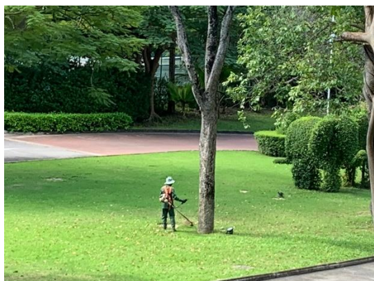
รูปที่ 2-20 บำรุง ดูแล รักษาพื้นที่สีเขียว