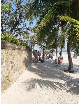
รูปที่ 2-21 การทำความสะอาดชายหาดหัวหิน