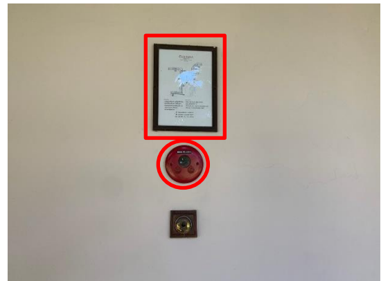
รูปที่ 2-23 เครื่องส่งสัญญาณเตือนไฟไหม้ภายในอาคาร และแผนผังแสดงเส้นทางหนีไฟ