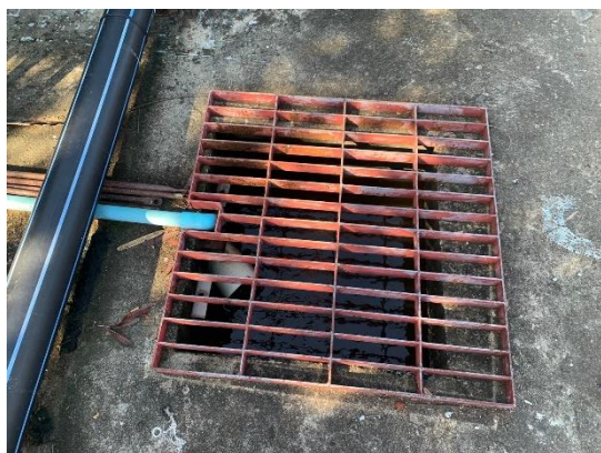
รูปที่ 2-3 ถังรับน้ำเข้า