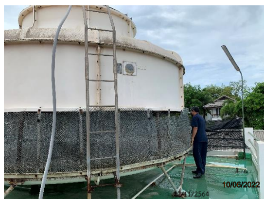
รูปที่ 2-34 (ต่อ) การตรวจสอบ บำรุงรักษา ระบบหอผึ่งน้ำ (Cooling Tower)