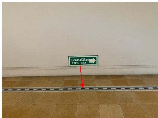
รูปที่ 2-26 แลปเรืองแสง นำทางหนีไฟ บริเวณพื้นทางเดินภายในอาคาร