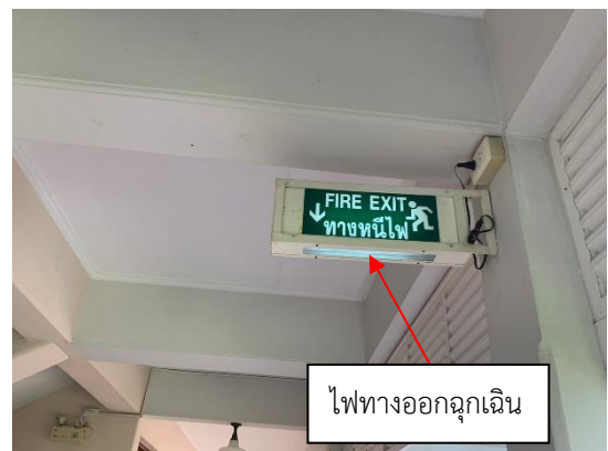
รูปที่ 2-25 ไฟฉุกเฉินบริเวณทางเดินภายในอาคาร