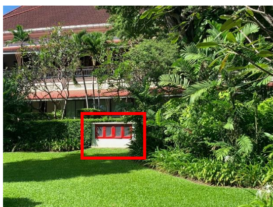
รูปที่ 2-30 ตู้เก็บสายฉีดน้ำดับเพลิงภายนอกอาคาร