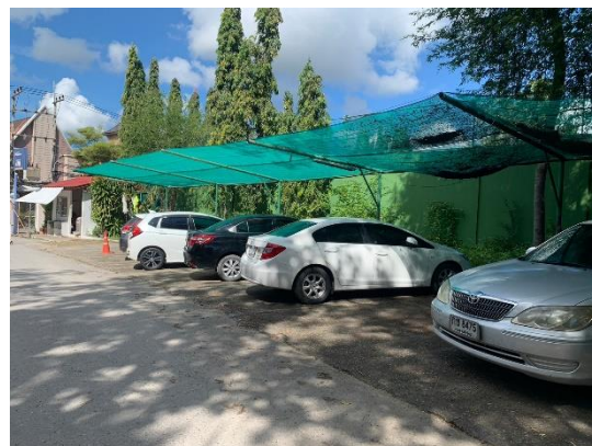
รูปที่ 2-32 (ต่อ) ลานจอดรถสำหรับผู้เข้าใช้บริการและ ลานจอดรถสำหรับพนักงาน