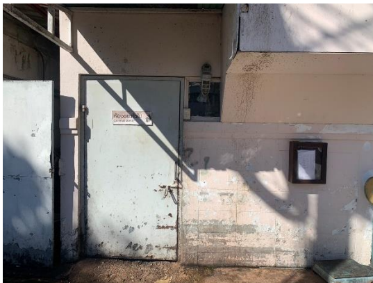
รูปที่ 2-15 ห้องพักขยะรีไซเคิล