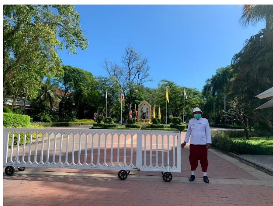
รูปที่ 2-33 เจ้าหน้าที่รักษาความปลอดภัย ตลอด 24 ชั่วโมง