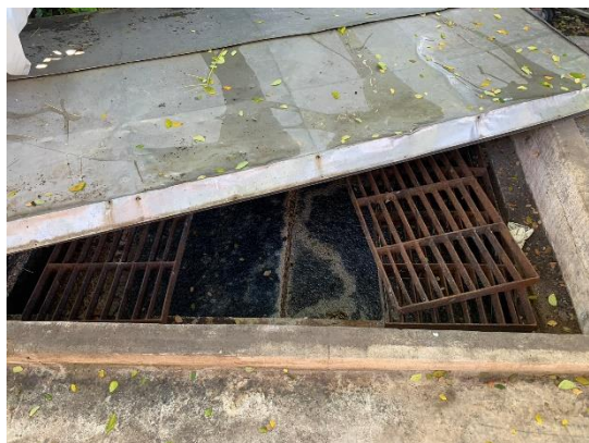
รูปที่ 2-1 บ่อดักไขมันบริเวณห้องอาหาร