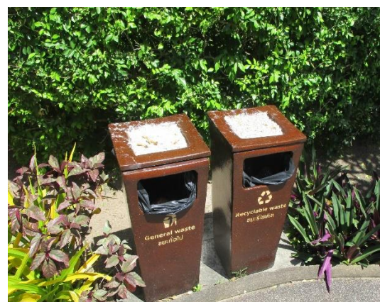
รูปที่ 2-18 ถังขยะแยกประเภทบริเวณพื้นที่โรงแรม