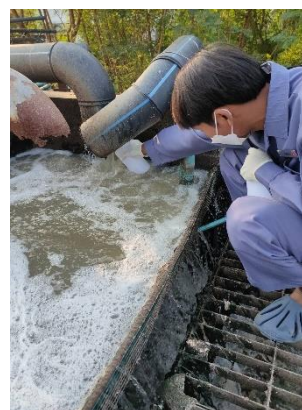
รูปที่ 2-10 การเก็บตัวอย่างน้ำจากระบบบำบัด