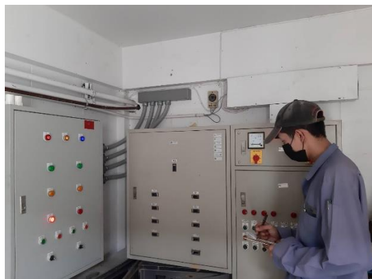
รูปที่ 2-8 เจ้าหน้าที่ดูแลระบบบำบัด (ผู้ควบคุมระบบไฟฟ้า)