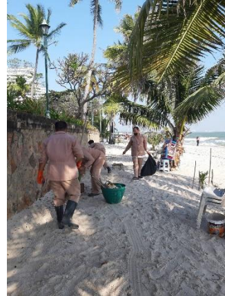
รูปที่ 2-21 (ต่อ) การทำความสะอาดชายหาดหัวหิน