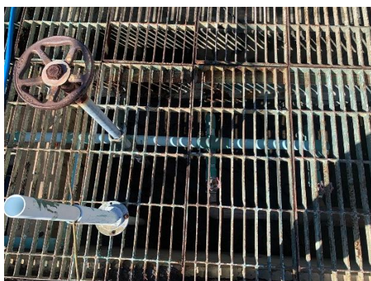
รูปที่ 2-5 บ่อดักตะกอน