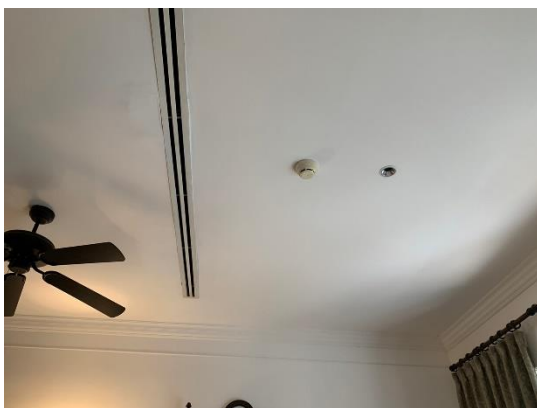
รูปที่ 2-24 เครื่องตรวจจับควันไฟภายในอาคาร