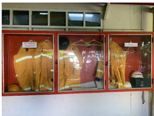
รูปที่ 2-28 อุปกรณ์ PPE อาคารช่าง