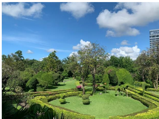
รูปที่ 2-19 พื้นที่สีเขียวภายในโรงแรม