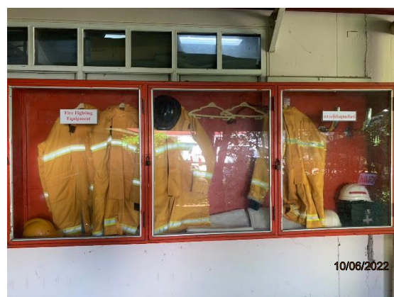
รูปที่ 2-31 ชุดอุปกรณ์สำหรับเจ้าหน้าที่ดับเพลิง และการตรวจสอบบำรุงรักษา