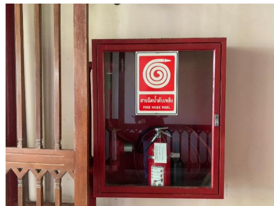
รูปที่ 2-27 ตู้จัดเก็บอุปกรณ์ดับเพลิง และสายส่งน้ำดับเพลิงภายในอาคาร