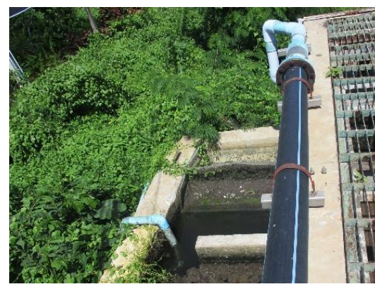
รูปที่ 2-6 บ่อสัมผัสคลอรีน